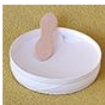
Snap-On с дървена лъжица