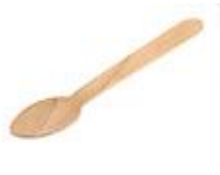
FCG 130F -140F – 160F