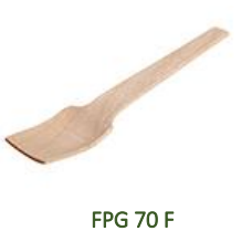
FPG 70 F