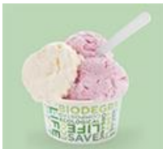
Серия S: BIO-64