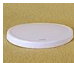
S-40 картонен за 160 & 200B