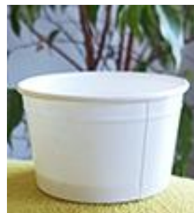
Серия K: BIO-White