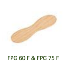
FPG 60 F & FPG 75 F