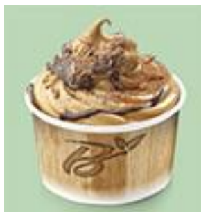
Серия S: BIO-60