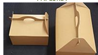
621 - 622 - PAP15KCP1