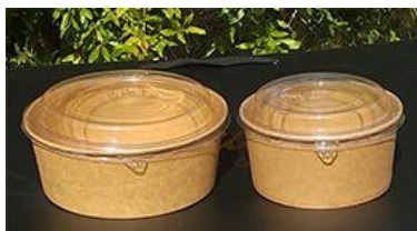
КРЪГЛИ Крафт купи за салата