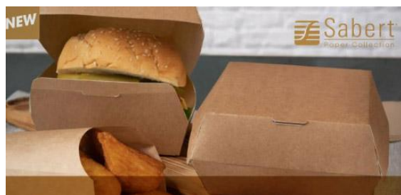
PAP15KCBV1 & PAP15KCBV2 (крафт кафяви)