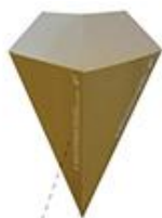
конуси 623 / 624