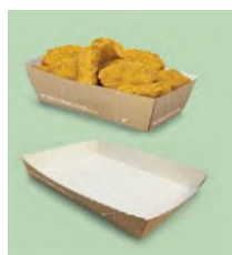
611 – 612 – 613 & 630