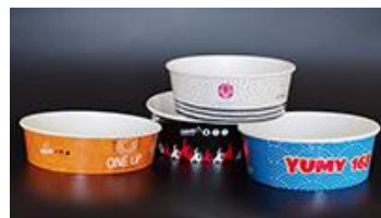
Брандирани купи за салата