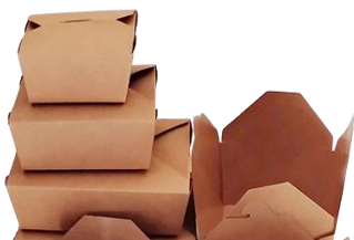
636-К до 640-К (Meal boxes)