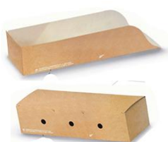
Hot Dog 605 / 620 & 616