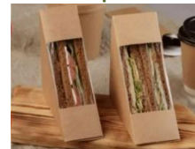
сандвичи KR/SD65 & 75