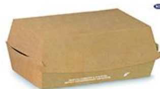
603 до 642 (бели отвътре)