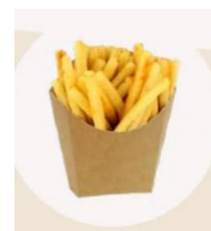
Chips крафтови CS1