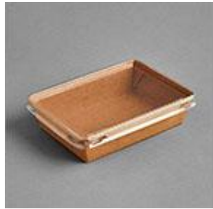
Tuk Tuk kraft