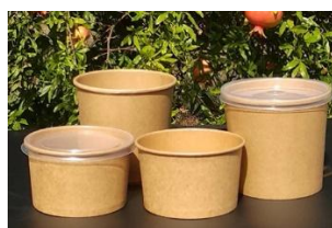
SB16-K & SB26-K bowl