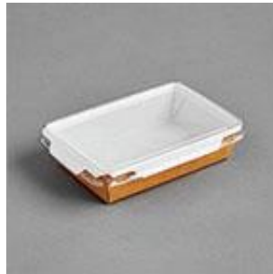
TukTuk Kraft/white (СКВ)

Крафтови кутии TUK TUK са винаги в наличност.