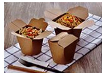
617-К (noodle box)