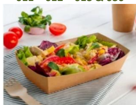
PAP15KTT1 & PAP15KMK2