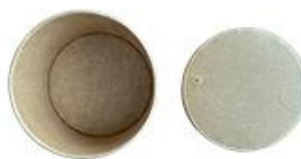
SB16 paper PP lid