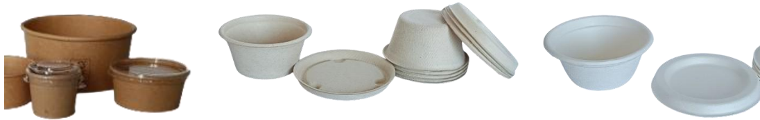
PAP12001PE & PAP12002PE