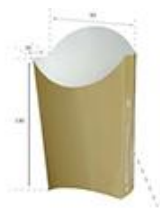
Класически (chips) 601 / 602