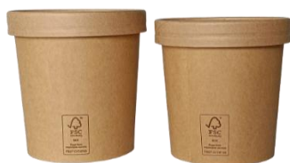
PAPSOU8PP -12PP & 16PP