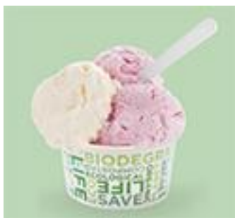
Серия S: BIO-64