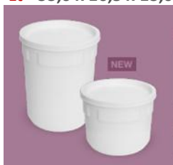
VR200 (2,5 & 6,0 L)