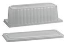
37,0 x 17,5 cm за 2.5 - 3.5 - 4.6 - 4.75 - 5 Lt