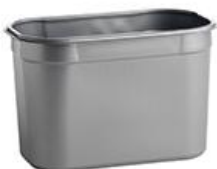
3.5 Lt - 36,0 x 16,5 x 8,0 cm 4 Lt - 25,0 x 15,0 x 15,0 cm