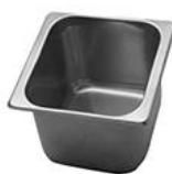
2.5 Lt - 18,0 x 16,5 x 12,0 cm