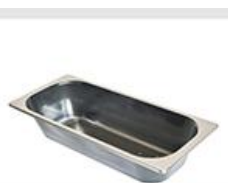
2.5 Lt - 36,0 x 16,5 x 7,0 cm

PS контейнери: устойчивост на температури от -30°C до +50°C