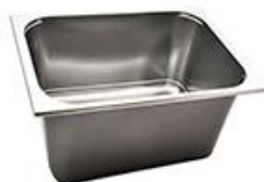
8 – 10 Lt - 36,0x25,0x12,0/15,0 cm